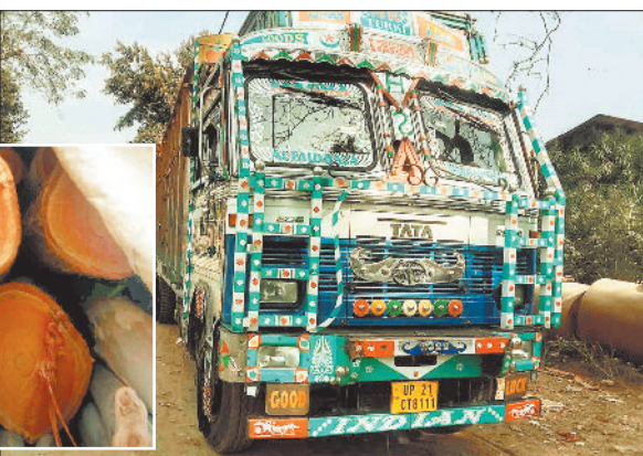
कार्रवाई के दौरान जब्त लकड़ी लोड ट्रक।

दोनों ट्रकों को पकड़ा। दोनो वाहनों में लोड लगभग 40 टन नीलगिरी लकड़ी के संबंध में ट्रक चालकों से दस्तावेज की मांग की तो दोनो के पास कोई दस्तावेज उपलब्ध नहीं था। वाहन चालकों के पास एसडीएम, तहसीलदार का अनुमति प्रमाण पत्र भी नहीं था और न ही ग्राम पंचायत द्वारा अनापति प्रमाण पत्र नहीं था। जिस पर वन विभाग की टीम ने नीलगिरी गोला लोड वाहनों को जब्त कर लिया। साथ ही ट्रक को सीतापुर वन विभाग में रखा गया है। वन विभाग के अधिकारियों ने बताया कि मुखबिर द्वारा सूचना देने के बाद दो ट्रकों में जब्त लकड़ी विकासखंड बतौली के ग्राम पंचायत टेंडगा से दो दिनों में हाइड्रा से लोड