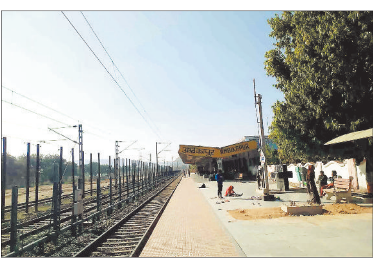
रेलवे स्टेशन परिसर।

तत्कालीन सांसद एवं रेल राज्य मंत्री लरंगसाय की पहल से जिला मुख्यालय को वर्ष 2006 में रेल सुविधा से जोड़ा गया। रेलवे द्वारा पैलेस की तर्ज पर भव्य रेलवे स्टेशन का निर्माण किया गया, लेकिन पहली बार किसी हालत की तर्ज पर ट्रेन का संचालन हुआ। तब रेल सुविधा से शहर का जुड़ना बड़ी उपलब्धि थी। वर्ष 2009 में पहली बार प्लेटफार्म का निर्माण किया गया, लेकिन छोटे स्टेशन की तरह स्टेशन बिल्डिंग के सामने के प्लेटफार्म पर ही शेड का निर्माण किया गया। धीरे-धीरे ट्रेनों के परिचालन में वृद्धि होने के साथ ही यात्रियों की संख्या में भी गुणात्मक वृद्धि हुई तथा यात्री सुविधाएं बढ़ाने की मांग जोर पकड़ने लगी। क्षेत्रवासी लम्बे समय से रायपुर सहित अन्य शहरों के लिए ट्रेन चलाने के साथ ही दूसरा प्लेटफार्म बनाने, पूर्व में बने एक मात्र प्लेटफार्म पर शेड, निर्माण कराने, वाशिंग पिट लाइन, कैटन आदि सुविधा शुरू करने की मांग कर रहे हैं। सर्वदलीय रेलवे संघर्ष समिति भी स्टेशन में सुविधाएं बढ़ाने को लेकर कई बार रेल मंत्रालय को जापान सौंप चुकी है। यात्री सुविधाओं का ध्यान रखते हुए रेलवे ने प्रथम