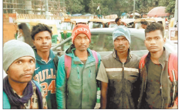
बंधक मुक्त पहाड़ी कोरवा।

जा रही सुविधाओं, शिक्षा व्यवस्था को लेकर चर्चा की। हॉस्टल में बच्चों के शौचालय बदलाने स्थिति में पाए गए इसके साथ ही नवनिर्मित भवन से सीपेज हो रहा था जिसे लेकर कलेक्टर ने गहरी नाराजगी जाहिर की। स्वच्छता, आवासीय सुविधा में अव्यवस्थाओं से नाराज कलेक्टर ने सहायक आयुक्त और अधीक्षक को व्यवस्था सुधारने के सख्त निर्देश दिए। उन्होंने निरीक्षण करते हुए बच्चों के शैक्षणिक स्तर से अस्तुत्व होकर मंडल संयोजक और अधीक्षक को नोटिस जारी किए जाने कहा। कलेक्टर ने बच्चों के बेहतर भविष्य के मद्देनजर शैक्षणिक स्तर को बढ़ाने शिक्षकों की इ्यूटी लगाकर स्कूल के बाद विशेष ध्यान देते हुए कोचिंग की सुविधा शुरू करने के निर्देश दिए।