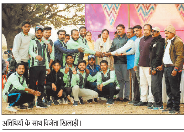
अतिथियों के साथ विजेता खिलाड़ी।

ग्राम पंचायत डेडरी में जिला स्तरीय क्रिकेट प्रतियोगिता का आयोजन किया गया। फाइनल मुकाबला में सलका की टीम विजयी रही। ग्राम डेडरी में आयोजित जिला स्तरीय क्रिकेट प्रतियोगिता में क्षेत्र के कुल 16 टीमों ने भाग लिया था। जिसमें से बेहतर खेल कर प्रदर्शन कर सकला व डेडरी की टीम ने फाइनल में जगह बनाई।