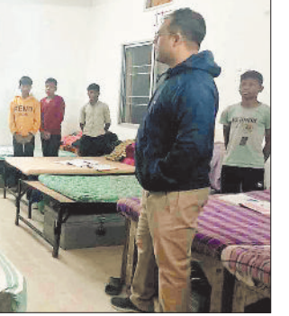
छात्रावासी बच्चों से चर्चा करते कलेक्टर।